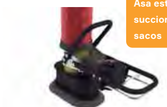
Asa estándar con succionador para sacos