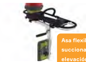
Asa flexible con succionador para la elevación lateral