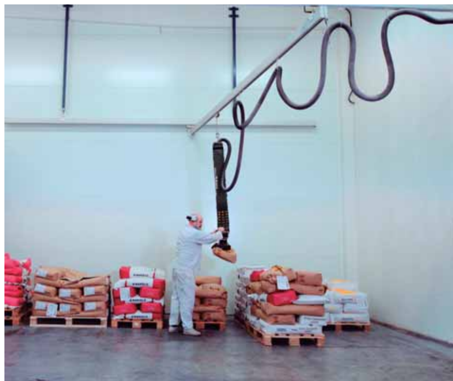
Elevador multifuncional TAWI

Los elevadores por vacío son muy fáciles de usar y cualquiera aprenderá a utilizarlos en cuestión de minutos.